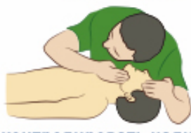
Проконтролировать наличие пассивного выдоха