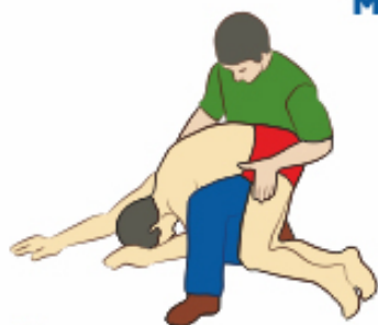
Удалить воду из дыхательных путей