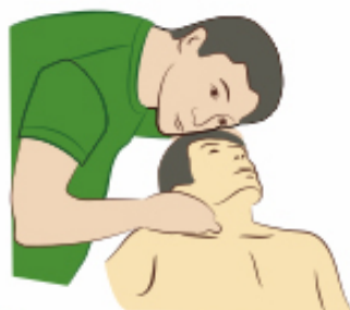
Установить наличие пульса на сонной артерии