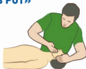
Очистить полость рта от инородных предметов