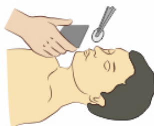
Определить состояние самостоятельного дыхания